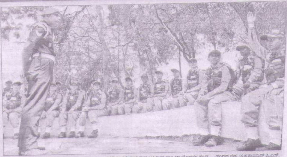
-ಸಂಗ್ರಹ ಚಿತ್ರ /ಕೃಷ್ಣಕುಮಾರ್ ಪಿ.ಮಿ ತರಬೇತಿ ಪಡೆಯುತ್ತಿರುವ ಆಗ್ನಿವೀರ ಮಹಿಳಾ ಯೋಧರ ತಂಡ